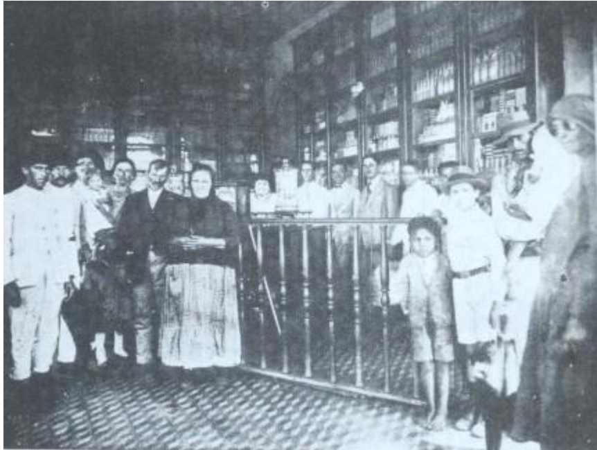
Interior da Pharmacia Nossa Senhora do Carmo