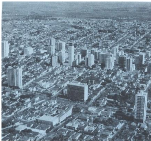
Vista aérea da cidade de São José do Rio Preto