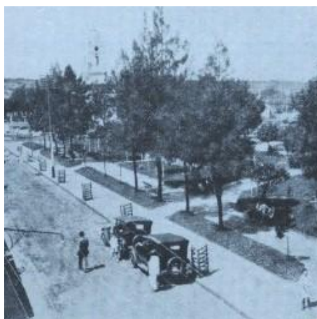
Trecho da Rua Bernardino de Campos, vendo-se parte da Praça Ruy Barbosa.